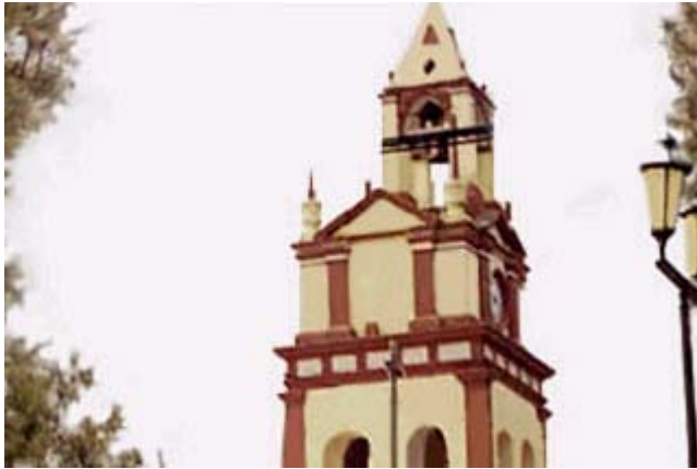
Parroquia de Nuestra Señora de Loreto