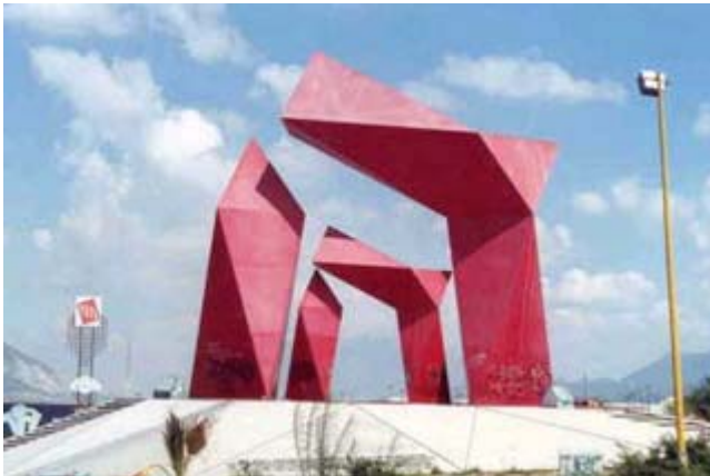
Escultura Puerta de Monterrey

San Nicolás se ubica al norte de la ciudad de Monterrey. Limita al norte con Escobedo y Apodaca, al sur con Monterrey y Guadalupe, al este con Apodaca y Guadalupe y al oeste con Monterrey. Se fundó el 5 de febrero de 1597 por Diego Díaz de Berlanga y acompañantes. Se erigió en villa el 16 de septiembre de 1830 y en ciudad el 9 de mayo de 1971. Se llama San Nicolás en honor de San Nicolás Tolentino, y de los Garza por Pedro de Garza. Anteriormente se llamaba Estancia de Pedro de la Garza y San Nicolás Tolentino. Cuna de Pablo A. de la Garza (1876-1932) General. Gobernador del Estado, participó en la Revolución Mexicana.