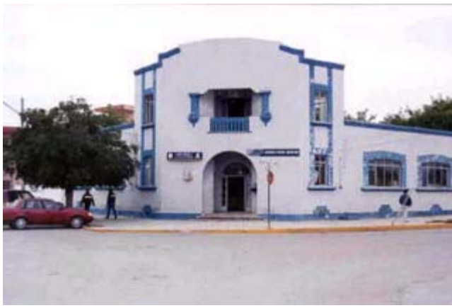
Oficina de Correos

Municipio: Anahuac Cabecera: Anahuac Superficie: 4,303.605 km 2 Población: 18,524 Página Oficial: http://www.anahuac.gob.mx