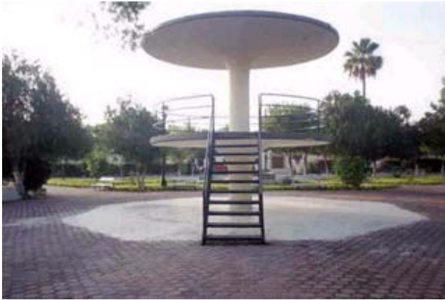
Kiosko, Plaza Principal Benito Juárez