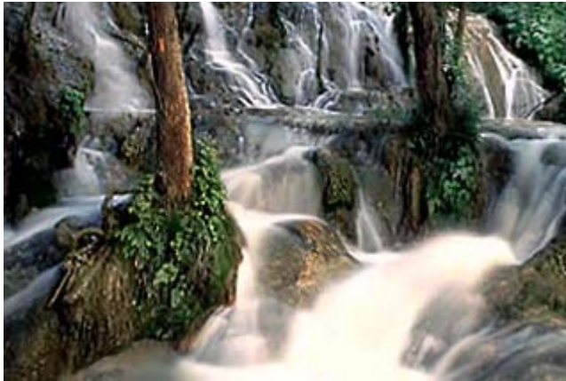
Cascada el Salto

General Treviño se localiza al noreste del Estado. Limita al norte con Agualeguas, al sur con Melchor Ocampo, al este con Tamaulipas y al oeste con Cerralvo y Agualeguas. Se fundó en 1688 por Francisco Chapa erigido en las tierras del Rancho del Puntigudo, para la explotación de recursos ganaderos. Se erigió en villa el 9 de diciembre de 1868 dándosele el nombre en memoria del general don Jerónimo Treviño, héroe durante la Reforma y el Imperio.