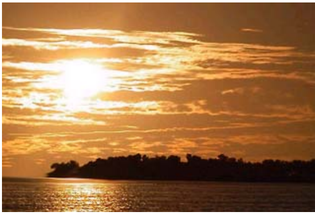
Presa la Boca