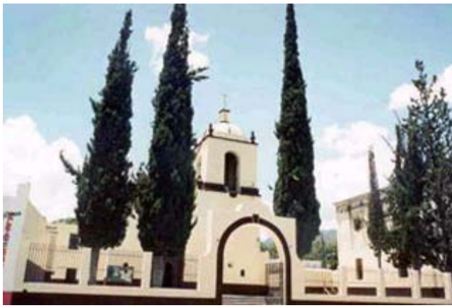
Iglesia Santa María de los Angeles

Municipio: Aramberri Cabecera: Aramberri Superficie: 2,809.410 km 2 Población: 14,840 Página Oficial: http://www.aramberri.gob.mx