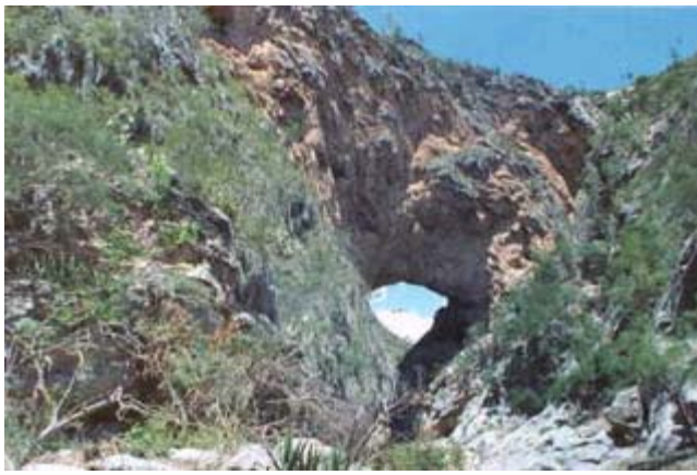
Puente de Dios, arco natural