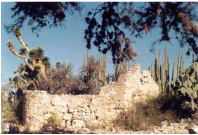
Primeras casas de la villa