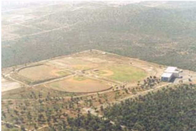
Academia Mexicana de Beisbol