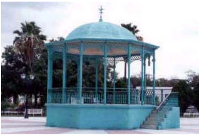
Kiosco de la Plaza Principal