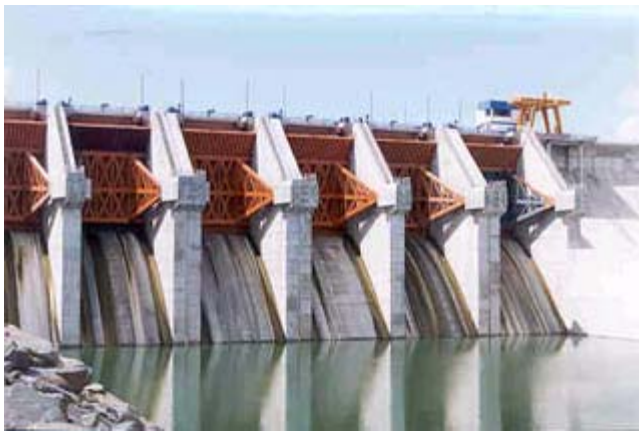
Presa el Cuchillo