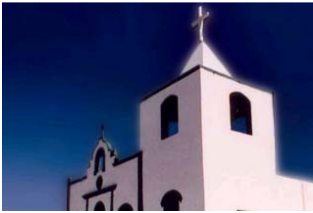
Ermita de la Santa Cruz