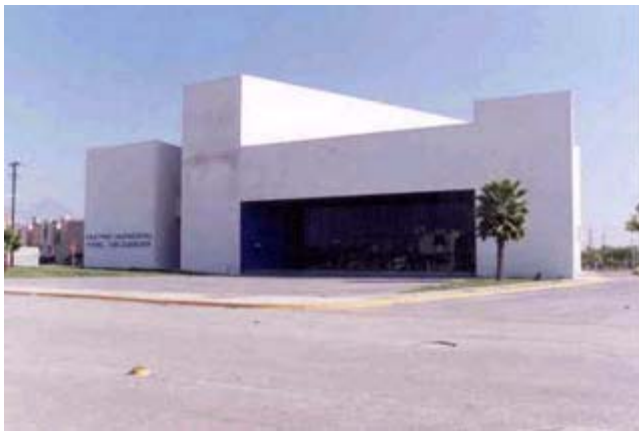
Teatro Municipal Fidel Velásquez

Municipio: General Escobedo Cabecera: General Escobedo Superficie: 207.057 km 2 Población: 224,790 Página Oficial: http://www.escobedo.gob.mx