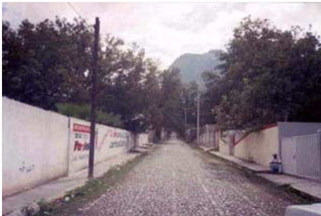
Vista de una de las calles del municipio