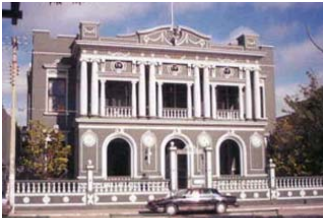
Casino de Linares

Lampazos se localiza al norte del Estado. Limita al norte y al oeste con Coahuila y Anáhuac, al sur con Bustamante, Villaldama y Sabinas Hidalgo, al este con Anáhuac, Vallecillo y Sabinas Hidalgo. Se fundó en 1698 por Fray Diego de Salara el nombre de Lampazos se debe a la planta de hojas grandes que crece a la orilla del ojo de agua y acequias de riego en lo que fuera la Misión de Nuestra Señora de los Dolores de la Punta de Lampazos. Se erigió en villa el 26 de octubre de 1877 y en ciudad el 28 de diciembre del mismo año. El nombre actual en honor del General don Francisco Naranjo, originario de este pueblo y héroe durante la intervención francesa y la guerra de reforma. Destacan de manera especial el edificio de la Misión de Nuestra Señora de los Dolores de la punta de Lampazos, actualmente museo y su Ojo de Agua, verdadero oasis en esta zona desértica. Cuna de Francisco Naranjo (1839-1908) Militar, participó en la toma de Monterrey y en la batalla de Plaza de San Luis. Derrotados los franceses, luchó al lado del general Díaz por el Plan de la Noria y Tuxtepec. Fue ministro de guerra y director del ferrocarril nacional mexicano.