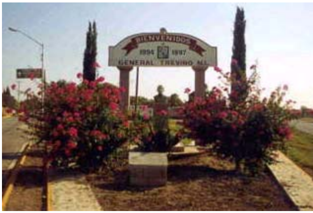
Monumento al General Jerónimo Treviño

Municipio: General Treviño Cabecera: General Treviño Superficie: 356.175 km 2 Población: 1,699 Página Oficial: http://www.generaltrevino.gob.mx