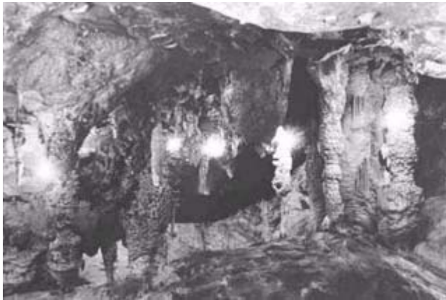
Grutas del Palmito o de Bustamante