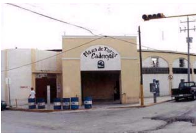
Plaza de Toros