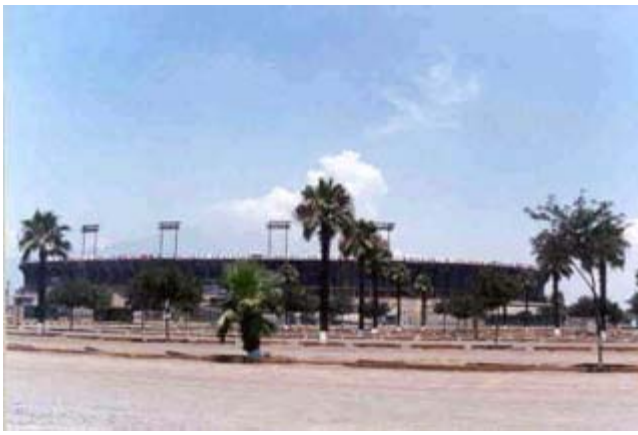
Estadio de Ciudad Universitaria

Municipio: San Nicolás de los Garza Cabecera: San Nicolás de los Garza Superficie: 57.186 km 2 Población: 496,878 Página Oficial: http://www.sanicolas.gob.mx