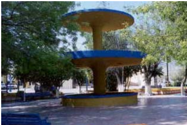
Kiosco de la Plaza Principal