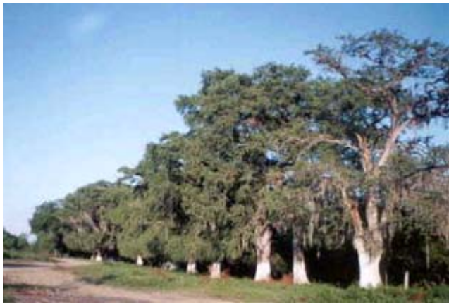
Centro Turístico El Sabinal