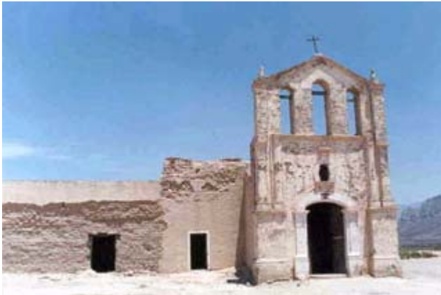
Hacienda de San Antonio de Arista. "Del Muerto"