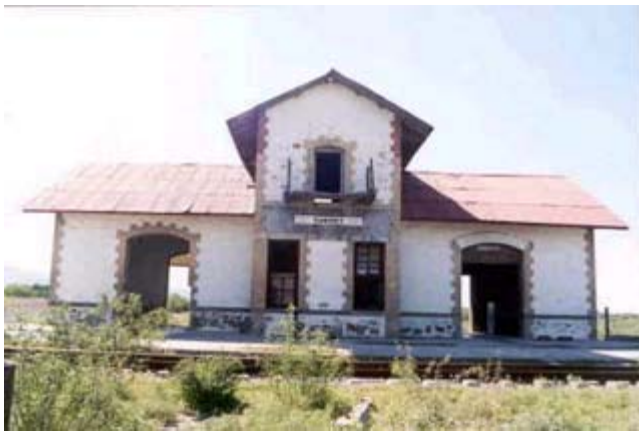
Estación de Pasajeros del Ferrocarril

Municipio: Los Ramones Cabecera: Los Ramones Superficie: 1,156.901 km 2 Población: 6,237 Página Oficial: http://www.losramones.gob.mx