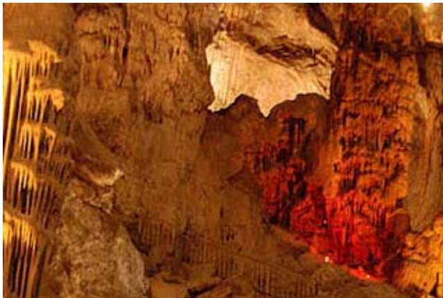
Grutas de García

Galeana se localiza al sur del Estado. Limita al norte con Rayones y Coahuila, al sur con Doctor Arroyo y Aramberri, al este con Rayones, Iturbide y Aramberri y al oeste con Coahuila, San Luis Potosí y Zacatecas. Los terrenos del Valle de San Pablo de los Labradores, fundado por Fernando Sánchez de Zamora en 1678, fueron denominados con el nombre actual en honor a don Hermenegildo Galeana, héroe de la Independencia que militó a las órdenes de don José Ma. Morelos y Pavón. Se erigió en villa el 14 de febrero de 1829. Es el municipio más extenso del Estado. Sus atractivos merecen una vista: El templo de San Pedro Apóstol, la casa natal de Mariano Escobedo, el Pozo del Gavilán, la laguna de Labradores, Pico del Potosí (la mayor elevación del Estado, con 3,635 metros sobre el nivel del mar) y el puente de Dios, un arco natural de 15 metros de altura. Cuna de Mariano Escobedo General y político mexicano que contribuyó al triunfo de la Reforma Liberal y tomó parte en la guerra contra la Intervención Francesa. Gobernador de Nuevo León y de San Luis Potosí.