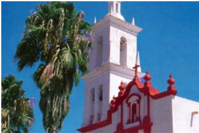
Iglesia de Nuestra Señora de Guadalupe

Sabinas Hidalgo se localiza al norte del Estado. Limita al norte con Lampazos de Naranjo, al sur con Salinas Victoria, al este con Vallecillo y Agualeguas y al oeste con Villaldama. Se fundó el 25 de julio de 1692 por Ignacio de Maya como Real Santiago de las Sabinas. Se erigió en villa el 23 de marzo de 1829 y el 7 de mayo 1971 se le otorgó el título de ciudad. Hoy es reconocida como un sitio de gran desarrollo económico, comercial e industrial. En ella se ha arraigado la industria del vestido para dama, la cual cuenta con más de un siglo de haberse iniciado. Los lugares característicos de esta ciudad son el templo de San José, frente a la Plaza, que data de 1710 y que tiene el único altar de estilo churrigueresco en el norte del país. En los bajos del Palacio Municipal está el Museo de Historia Regional. Cuna de Antonio R. del Valle Poeta.