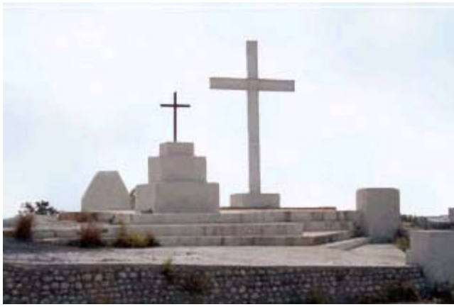
Loma de la Cruz