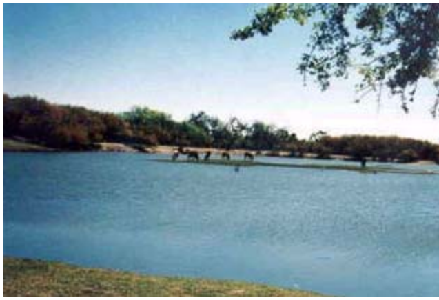
Laguna de Higueras

Municipio: Higueras Cabecera: Higueras Superficie: 669.889 km2 Población: 1,371 Página Oficial: http://www.higueras.gob.mx