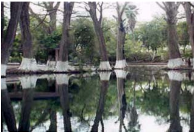
Ojo de Agua