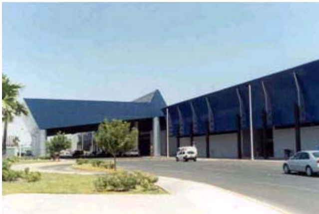
Aeropuerto Internacional "Mariano Escobedo"