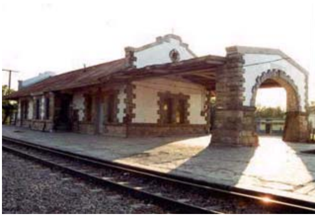
Estación de ferrocarril