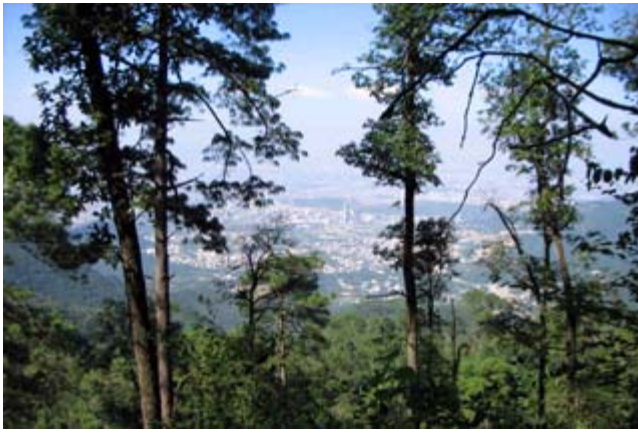
Parque Ecológico Chipinque

Municipio: San Pedro Garza García Cabecera: San Pedro Garza García Superficie: 91.534 km2 Población: 125,978 Página Oficial: http://www.sanpedro.gob.mx