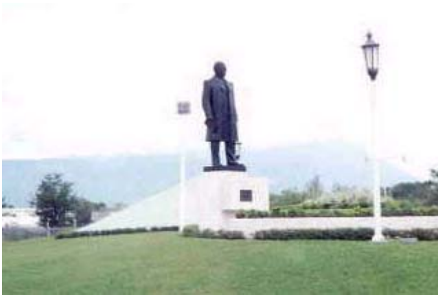
Monumento a Benito Juárez

Iturbide se localiza al sureste del Estado. Limita al norte con Rayones, al sur con Aramberri, al este con Linares y Tamaulipas y al oeste con Galeana. Se fundó en 1802 por José Ma. Moreno y Alcarza y Juan Camacho. Se le dio este nombre en memoria de don Agustín de Iturbide, consumador de la Independencia Nacional y se erigió en lo que fuera la Hacienda de los San Pedro, ubicada en un lugar considerado como punto estratégico en las comunicaciones de la época. Se erigió como villa el 9 de marzo de 1850. Un lugar verdaderamente insospechado por su tranquilidad y belleza. En sí, Iturbide es un monumento a la Montaña, como lo es su templo de San Pedro Apóstol, de origen franciscano y construido a principios del siglo XIX, o el monumental bajorrelieve hecho por Federico Cantú sobre una losa de la sierra de la carretera: El famoso bajorrelieve de Los Altares. Cuna de Federico Amaya Rodríguez Militar y político. Embajador de México en Guatemala y en Yugoslavia, comandante de la VII Zona Militar en Monterrey, Senador por Nuevo León.