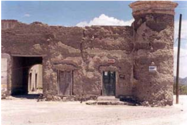
Hacienda de Santa Gertrudi